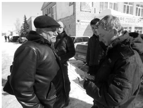
В поселке Бабынино...